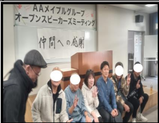
AA(自助グループ)メイプルグループスピーカーズミーティング 広島へ足を運びました