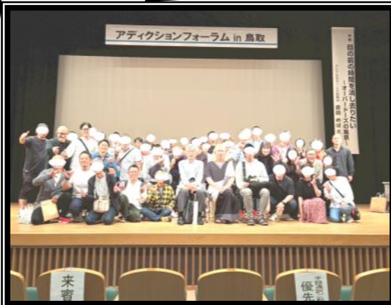
アクションフォーラムin鳥取 依存症の啓発活動に数多くの団体やグループが参加されました