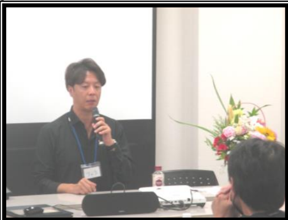
岡山家族会びあ① 家族へ向けてのメッセージ活動もしています