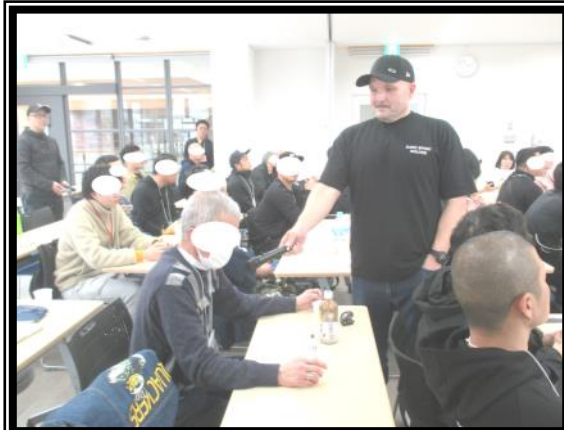
講師を招きTCCプログラムを提供して頂いています 意欲的に発言をしている1コマです