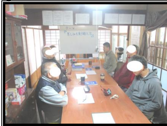
ダルクミーティング 回復の基本となるミーティングです