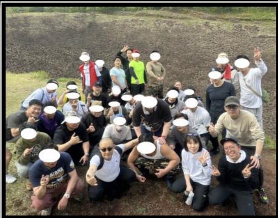
GW岡山・鳥取ダルク合同フェロシップ 神鍋高原へ観光に行きました