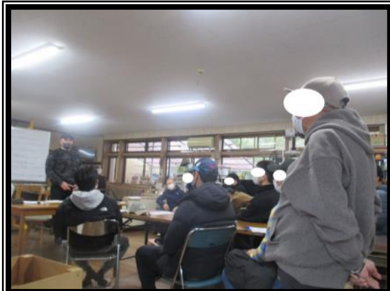
講師を招きTCCプログラムを提供して頂いています 仲間皆でプログラムを作りあげます