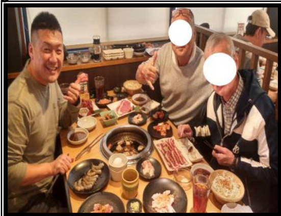
レクリエーション(焼肉食べ放題) 美味しいものを食べるのも回復の一つです