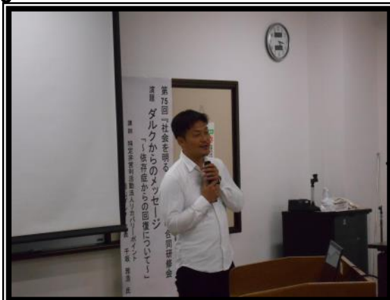
玉野地区保護司会講演② メッセージ活動が回復に繋がります