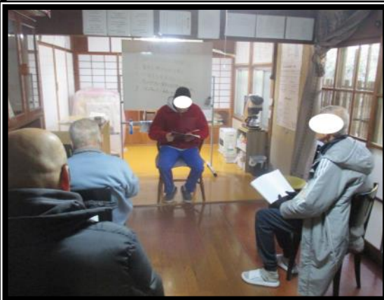
スピーカーズミーティング① 1人20分間の体験談を話します