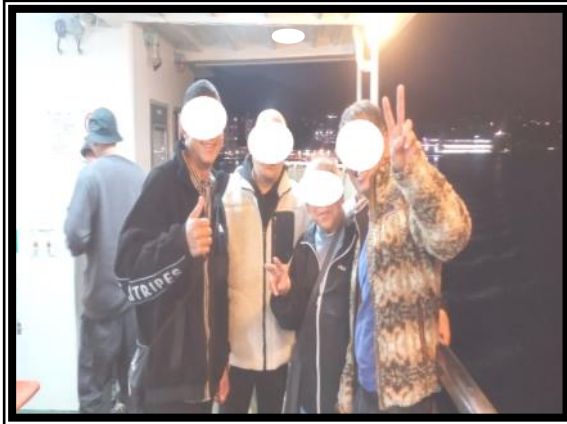
広島宮島観光 色々な所へ飛びまわっています