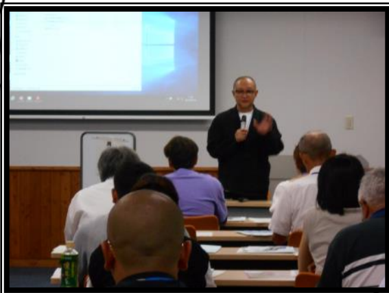
引受人懇談会 支援者へのメッセージ活動も行っています