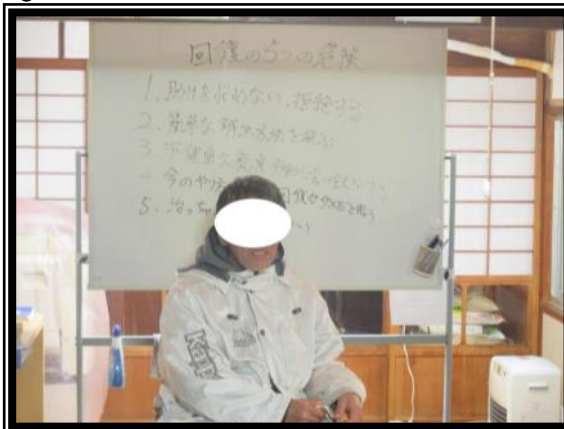
スピーカーズミーティング② 経験・力・希望を分かち合います