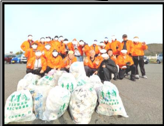
備前大橋清掃ボランティア この活動を通して何かの役に立てている感覚を身につけています